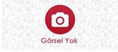
İnsan Kaynakları Sorumlusu